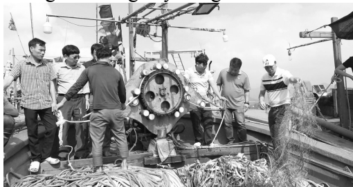
Mô hình tời thủy lực thu lưới rê tầng đáy cho các đội tàu khai thác hải sản xa bờ.

được trang bị dài hơn, đánh bắt ở những vùng biển xa bờ hơn, vùng nước sâu hơn,... ngày càng phổ biến đặt ra yêu cầu cấp thiết về trang bị cơ giới hoá, hiện đại hóa trong các khâu, các công đoạn tìm kiếm ngư trường, kiểm soát lưới, đặc biệt khâu thu - thả lưới trên tàu nghề rê tầng đáy vùng khơi.