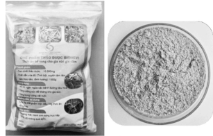
Chế phẩm thảo dược BIOHEVI.

đó, nếu sử dụng chế phẩm BIOHEVI, tỷ lệ sống 100%. Điều này cho thấy, chế phẩm có tác dụng hỗ trợ sức đề kháng, giúp vật nuôi khỏe mạnh, tăng trưởng tốt, do hiệu quả kháng các vi khuẩn đường ruột từ các thành phần trong cao chiết trong chế phẩm.