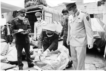
Gần 3,3 tấn nằm lợn không rõ nguồn gốc xuất xứ bị bắt giữ ngày 9/3.

Trên tuyến đường Lạng Sơn – Bắc Giang, các lực lượng chức năng thường xuyên kiểm tra, bắt giữ những chiếc xe ô tô vận chuyển nội tạng không rõ nguồn gốc xuất xứ, hồi thối về các tỉnh thành để tiêu thụ.