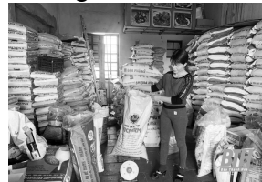
Thường xuyên kiểm tra cửa hàng kinh doanh thức ăn chăn nuôi cho gia súc.

Chất cấm trong chăn nuôi còn được gọi là chất tạo nạc thuộc nhóm Beta-agonist, với 3 chất tiêu biểu là Clenbuterol, Salbutamol và Ractoppamine; đây là các chất đứng đầu bảng của danh mục 18 chất kháng sinh, hóa chất bị cấm sử dụng trong chăn nuôi. Nhóm hóa chất này theo các nhà khoa học sẽ gây nguy hiểm đến sức khỏe, tính mạng của con người nếu ăn phải thịt của vật nuôi sử dụng nhiều chất cấm.