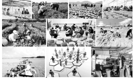
Ảnh minh họa.

Đẩy mạnh ứng dụng công nghệ cao trong lĩnh vực nông nghiệp, phấn đấu đến năm 2030 cả nước có trên 5.000 hợp tác xã và 500 tổ hợp tác ứng dụng công nghệ cao vào sản xuất và tiêu thụ nông sản; thực hiện truy xuất nguồn gốc đối với hàng hóa nông sản; tăng cường liên kết theo chuỗi giá trị giữa doanh nghiệp và hợp tác xã, phấn đấu có khoảng 50% hợp tác xã nông nghiệp liên kết với doanh nghiệp theo chuỗi giá trị; xử lý dứt điểm các hợp tác xã đã ngừng hoạt động và các hợp tác xã chưa chuyển đổi, tổ chức lại theo Luật Hợp tác xã năm 2012.