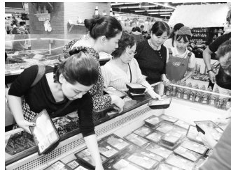
Đảm bảo an toàn thực phẩm, phòng ngừa ngộ độc thực phẩm trong tình hình bình thường mới (Ảnh minh họa)

Ban chỉ đạo liên ngành về an toàn thực phẩm Trung ương đã ban hành Kế hoạch triển khai “Tháng hành động vì an toàn thực phẩm” năm 2021. Theo kế hoạch, chương trình sẽ diễn ra trên phạm vi toàn quốc từ ngày 15/4 - 15/5/2021.