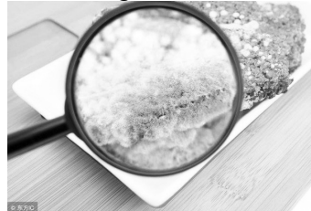
Ăn thực phẩm nấm mốc gây hại sức khỏe. Ảnh minh họa.

Các chuyên gia dinh dưỡng cũng cho biết, khi mua thực phẩm bị mốc hoặc bảo quản thực phẩm kém, thực phẩm sẽ dễ bị các loại nấm xanh, nấm có mũ,... và sản sinh ra chất aflatoxin - đây là chất độc gây hại khắp cơ thể nhưng nhiều nhất là gan.