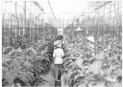
Mô hình nuôi thiên địch bảo vệ cây trồng mở ra cơ hội phát triển nông nghiệp sạch.

So với sử dụng thuốc bảo vệ thực vật thì tiết kiệm được 50% chi phí trong khi hiệu quả cao hơn nhiều lần.